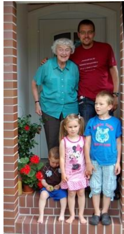
Zwischenstop bei „Urgroßi“ in Wiederitzsch