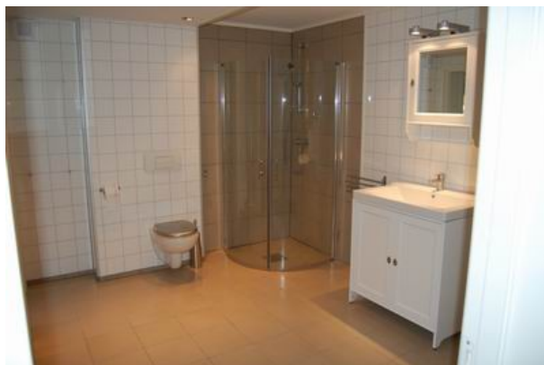
... und sollte vielleicht erst mal duschen.

Jetzt blitzt und blinkt es, sowohl in der neuen Erdgeschoßwohnung in unserem Haus auf Haramsøy, als auch auf unserem Konto. Das Bauprojekt ist abgeschlossen. Endlich ist der letzte Pinselstrich getan, der letzte Nagel eingeschlagen und der letzte Wasserhahn angeschraubt. Hat ja auch bloß 2 Jahre gedauert... Mieter haben wir auch gefunden, ein junges Paar.