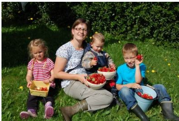
Resterte der Erdbeeren

Leider brachten das geräumige Taxi und 5000 km auf dem Mittelsitz hinten im Skoda Jana zu der felsenfesten Überzeugung, daß wir ein anderes Zugfahrzeug für unseren Wohnwagen brauchen. Für unseren gerade reparierten 10 Jahre alten Oktavia noch einen vertretbaren Preis zu erlangen, schien illusorisch. Deshalb kam das jüngere unserer Autos, der Roomster, auf die „Abschussliste“. Das schöne, aber zu kleine, silberne Fahrzeug mit seinen Ledersitzen wurde eingetauscht gegen einen praktischen siebensitzigen VW Caddy life in einer Farbe, die sich am ehesten als „Blaufichte“ bezeichnen lässt. Die Innenverkleidung hinten ist sparsam gehalten und in schmutzfreundlichen Metall und Plaste. Die sieben Sitze sind irgendwie ständig mit uns nicht verwandten Leuten im Kindergarten- und Grundschulalter besetzt, die scheinen sich also zu bewähren.