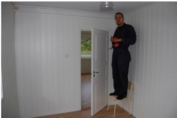
... Micha kann runterkommen ...