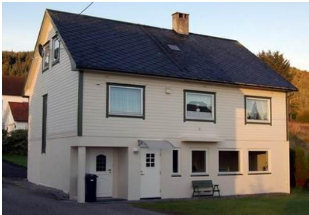
Das Haus ist erstmal fertig ...