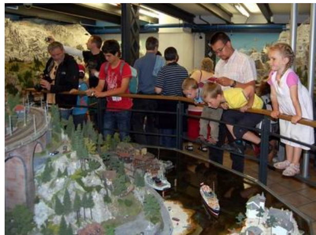
Skandinavien im Miniaturwunderland