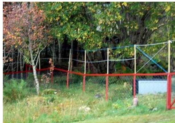
Nicht schön, aber mal sehen, ob es gegen die Hirsche hilft.

Für den ein oder anderen Verbiss im Frühjahr hatten wir auch noch ein gewisses Verständnis, und die Erdbeeren und die Kirschbäume waren bereits eingezäunt, aber das Verwüsten sämtlicher Obstbäume erforderte nun schnelles Handeln: In einer Nacht-und-Nebelaktion wurde mit 15 Meter Maschendrahtzaum die letzte Lücke zum Wald geschlossen. Jetzt hoffen wir nur, dass er auch hoch genug dafür ist, um die Hirsche auf den rechten Pfad der Tugend zurückzuführen.