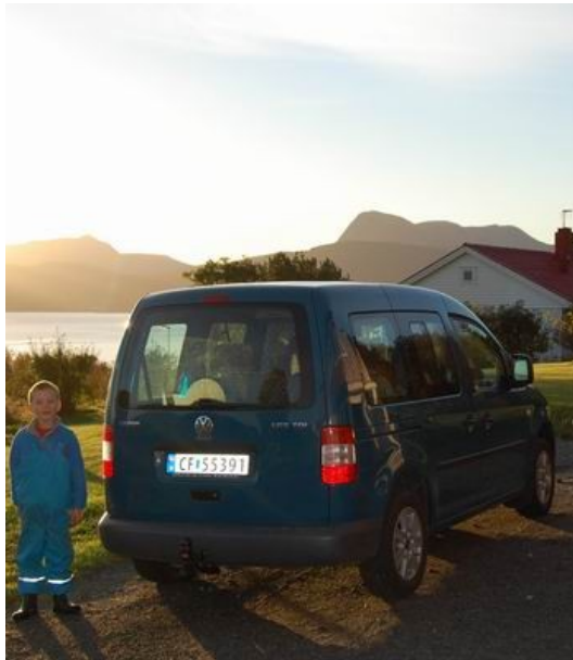
Stolzer Beifahrer mit Fahrzeug

Leider brachten das geräumige Taxi und 5000 km auf dem Mittelsitz hinten im Skoda Jana zu der felsenfesten Überzeugung, daß wir ein anderes Zugfahrzeug für unseren Wohnwagen brauchen. Für unseren gerade reparierten 10 Jahre alten Oktavia noch einen vertretbaren Preis zu erlangen, schien illusorisch. Deshalb kam das jüngere unserer Autos, der Roomster, auf die „Abschussliste“. Das schöne, aber zu kleine, silberne Fahrzeug mit seinen Ledersitzen wurde eingetauscht gegen einen praktischen siebensitzigen VW Caddy life in einer Farbe, die sich am ehesten als „Blaufichte“ bezeichnen lässt. Die Innenverkleidung hinten ist sparsam gehalten und in schmutzfreundlichen Metall und Plaste. Die sieben Sitze sind irgendwie ständig mit uns nicht verwandten Leuten im Kindergarten- und Grundschulalter besetzt, die scheinen sich also zu bewähren.