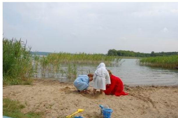
Nach dem Baden ist vor dem Baden