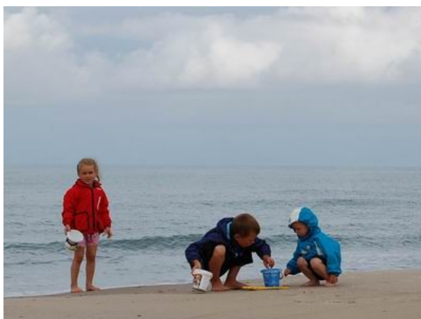
In Dänemark, vor der Abreise mit der Fähre ...