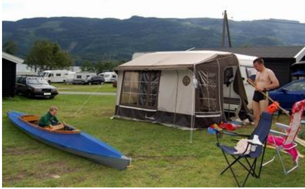
Dritt- und ...

Ansonsten begnügen wir uns mit unserem mobilen „Dritthaus“. Der über 20 Jahre alte Wohnwagen Typ Bürstner 500 TM Club fand bereits im Herbst letzten Jahres zu uns, durfte aber den Winter statt draußen im Schnee in einer trockenen und warmen Halle verbringen. Im Sommer leistete er uns dann gute Dienste als Familienheim auf Zeit. Auch wenn wir wie Nomaden durch die deutschen und skandinavischen Lande tourten, konnten so die Kinder jeden Abend im gleichen Bett schlafen und wir hatten so doch gelegentlich eine Chance auf ein Glas Wein zu zweit oder mit lieben Freunden. Das Campingleben gefiel wie erhofft allen sehr, wir hatten Glück mit dem Wetter und das einzige was fehlte war ein Grill...Man lernt immer dazu. Strohhut, Grillschürze und Sonnenblumensandalen