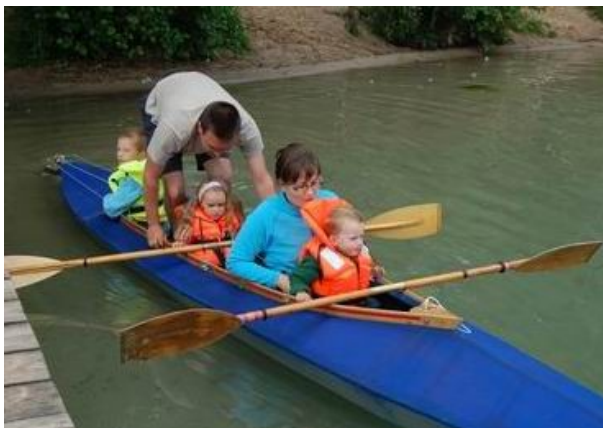
Alle Mann an Bord ! ? !

machen dann das Bild komplett....hehehe.