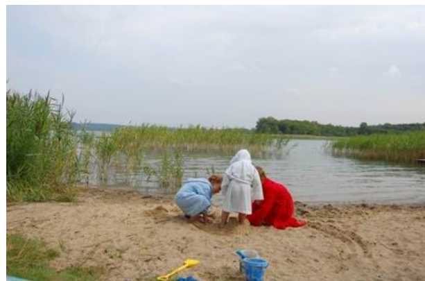
Nach dem Baden ist vor dem Baden