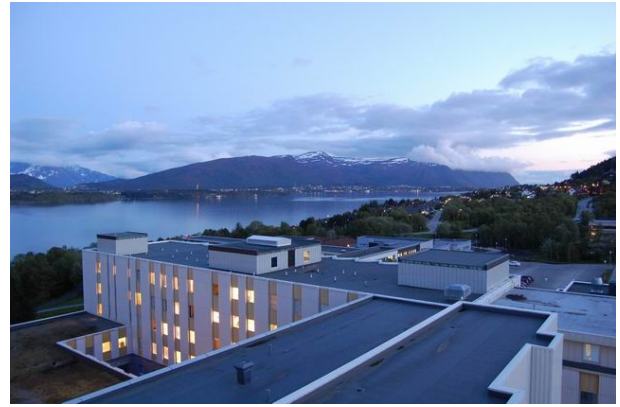
... und am Ende der Geburt.